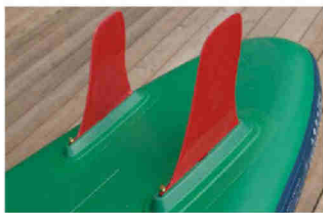
Bei Red Paddle werden seitlich Stabilisatoren in vorgesehene Taschen geschoben. Die zwei Finnen haben weniger Tiefgang als üblich, aber viel Fläche.

meinde gefunden hat und die komplette Ausstattung. Das Touring 12'8" x 31" verbindet sehr gute Kippstabilität mit einem flüssigen, flotten Paddelerlebnis. In Turns (Seite 55 unten) bietet das breite Heck reichlich Stützfläche, der schmale Bug mit sehr schöner Verrundung der Unterseite sorgt für sportliches Feeling und flottes Tourentempo. Die Verarbeitung wirkt sauber und solide, ein schönes Feature ist der zweiteilige Finnenkasten für einfacheres Rollen.