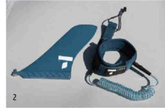
Bei F2 (1) sind zwei Softe Finnen aufgeklebt, die zusätzliche Mittelfinne ist kurz. Bei Tahe (2) liegt die eine gute Leash und ein (einfaches) Paddel im Paket.